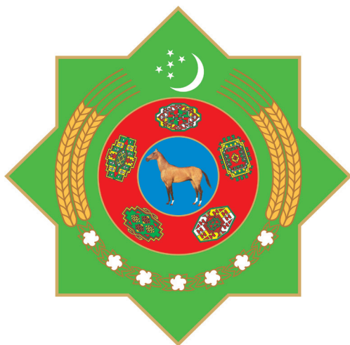
TÜRKMENISTANYŇ DÖWLET TUGRASY