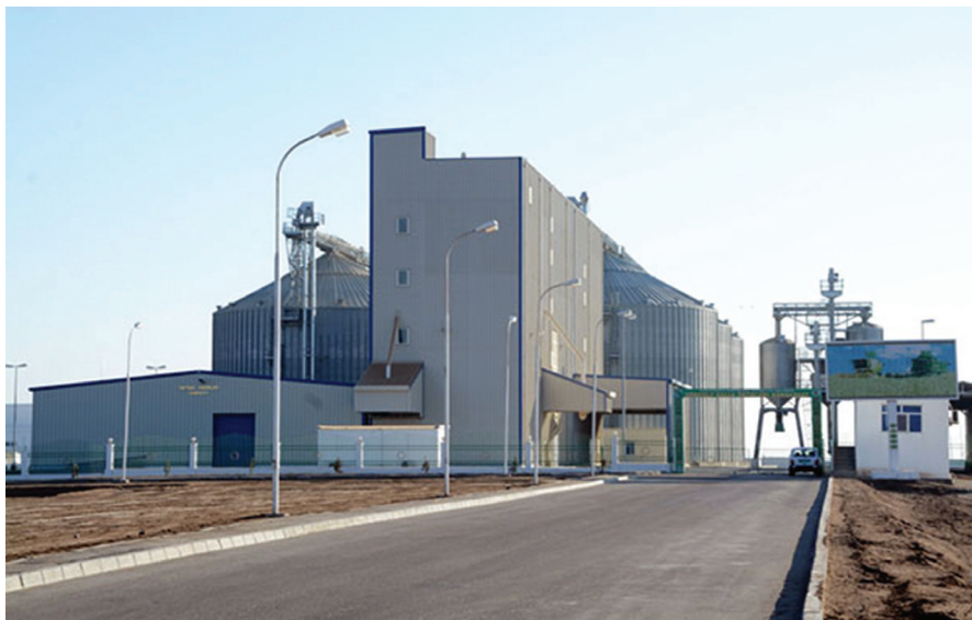
Daşoguz welaýatynyň Boldumsaz etrabyndaky häzirki zaman elewatory

gerekli azyk önümleriniň köp bölegi beýleki ýerlerden getirilýärdi.