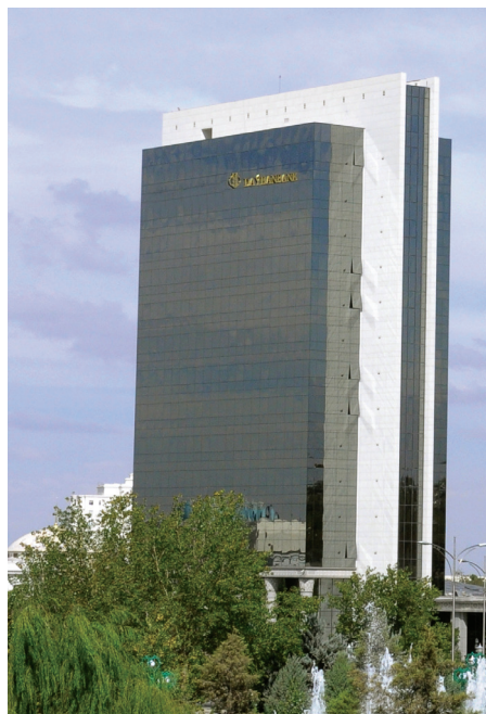
«Daýhanbank» döwlet täjirçilik banky

Milli bank ulgamynda alnyp barylýan işleriň esasy ugry telekeçileri, ozaly bilen haryt öndürýän telekeçileri goldamakdyr. Mysal üçin, «Senagat» döwlet täjirçilik banky öz welaýat bölümleri bilen bilelikde önümçilik häsiýetli taslamalary amala aşyran telekeçilere karz pul berýär. Karzlaryň möhleti 3 aýdan 2 ýyla çenli, möçberi bolsa taslamanyň 25-30%-ne deň bolup, olar daşary ýurt tehnologiýa enjamlaryny almaklyga gönükdirilýär. Abadan şäherinde ýüň egirýän husu-