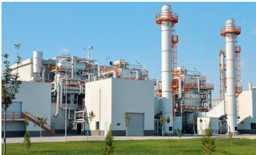
Mary welaýatynyň Karbomid zawody