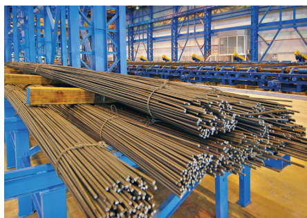
Owadandep. Metallurgiýa zawody