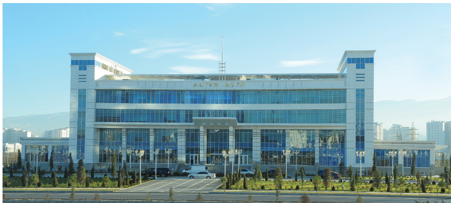
Aşgabatdaky «Altyn asyr» öýjükli aragatnaşyk kärhanasy

Türkmenistanyň aragatnaşyk ulgamyny ösdürmeklige telekommunikasiýalar serişdelerini öndürmekde meşhur nemes kompaniýalary «Siemens», «Alcatel» we başgalar çekildi. 1992-nji ýylda Aşgabatda ilkinji sanly awtomatik telefon stan-