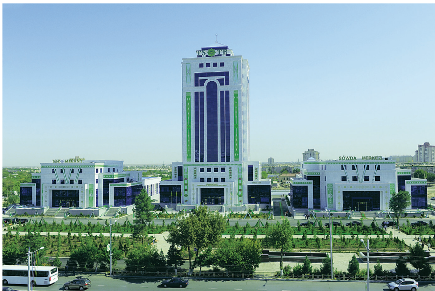
Türkmenistanyň Senagatçylar we telekeçilik merkezi

Hojalygy ýöretmegiň dünýä tejribesi eýeçiligiň dürli görnüşlerine esaslanýan ykdysadyýetiň, has takygy, garyşyk ykdysadyýetiň bäsleşige, erkin bahalaryň emele gelmegine ukyplydygyny, şahsy göreldeleriň döremegine we ösmegine has oňalydygyny äşgär görkezýär. Garyşyk ykdysadyýeti kemala getirmek eýeçiligi döwletiň garamagyndan aýyrmak, ykdysadyýetiň döwlete dahylsyz bölegini ösdürmek bilen bagly bolup durýar. Türkmenistanda döwlet eýeçiligini hususlaşdyrmak hakynda kabul edilen kanunda (1993 ý.) «eýeçiligi döwletiň garamagyndan aýyrmak» diýen düşünjaniň manysyna kesgitleme berilýär. Ol hojalygy dolandyryş ygtyýarlarynyň we wezipeleriniň kärhanalar derejesine berilmegini, döwlet eýeçiliginiň başga eýeçilik görnüşlerine, ýagny bellibir köpçüligiň ygtyýaryndaky kärhanalara, paýdar jemgyýetlerine, kooperatiwlere, döwlet eýeçiliginde durmaýan beýleki kärhanalara öwrülmeğini aňladýar.