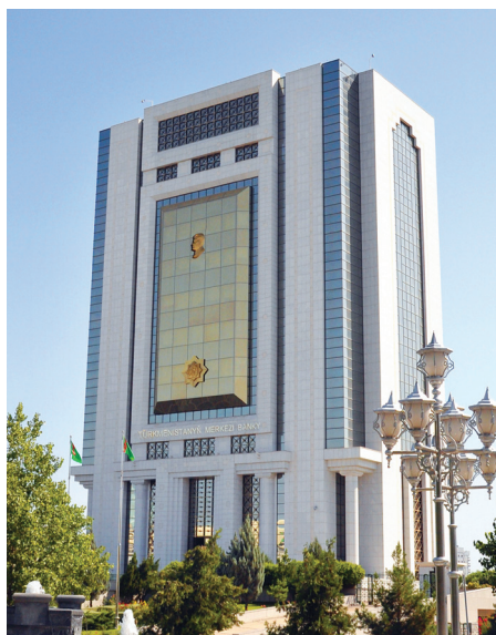
Türkmenistanyň Merkezi banky

Türkmenistanyň Döwlet banky Merkezi banka öwrüldi. Döwlet plan komiteti (Gosplan) hem-de Maliýe ministrligi ýatyrylyp, olaryň esasynda Ykdysadyýet we maliýe ministrligi 1 döredildi (1993 ý.). Ol döwletiň maliýe serişdeleriniň peýdalanylyşyny guraýar we dolandyrýar. Öňki banklardan Süýşürtingiler, soňra «Halkbank» banky (ýurduň ähli ýerlerinde öz bölümleri bilen) işlemegini dowam edýär. Täze banklar açyldy: «Senagat» (1989 ý.), paýdarlar täjir-