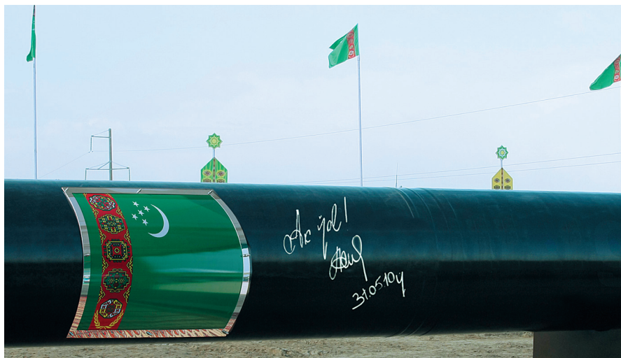
Türkmenistan – Özbegistan – Gazagystan – Hytaý gazgeçirijisi

Nebit-gazly ýataklary özleşdirmegiň esasy şerti uglewodorod çig malyny hemmetaraplaýyn peýdalanmaktan ybaratdyr, çünki birentek ýataklarda tebigy gazyň düzümünde senagatda ulanylýan etan, propan, butan, kükürt we geliý bar. Şonuň üçin nebitgaz senagatyny ösdürmegiň 2030-njy