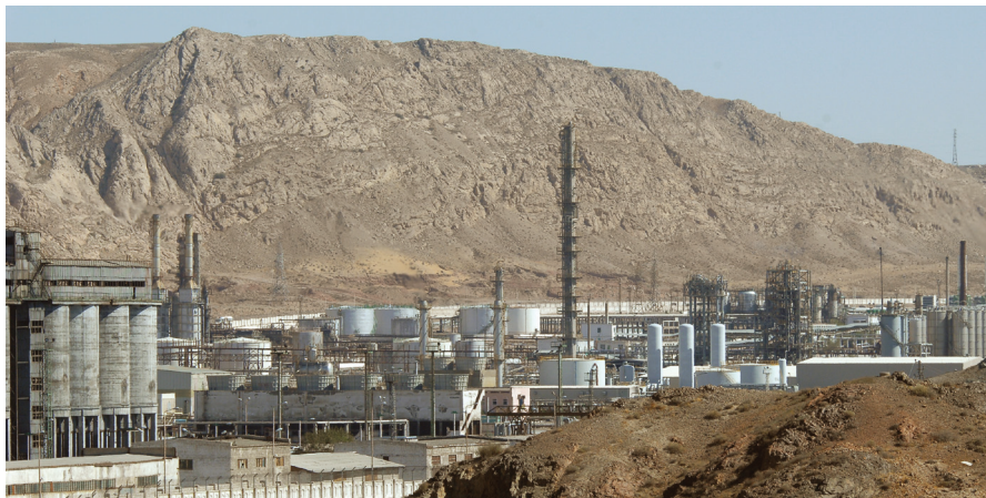
Türkmenbaşy adyndaky nebiti gaýtadan işleýän zawodlar toplumu

Geologiýa gözleginiň maglumatlaryna (2010 ý.) görä, Türkmenistanda nebitiň gurlary 20,8 mlrd t , gazyň gurlary bolsa 24,6 trln kub m-e barabardyr. Şonça ýangyç serişdelerinden nebitiň 12 mlrd t-sy gazyň hem 6,2 trln kub m-i Hazar deňziniň türkmen böleginde ýerleşýär. Bu ýerde «Petronas», «Dragon Oýl», «Itera» we käbir beýleki daşary ýurt kompaniýalary, türkmen tarapy bilen şertna-