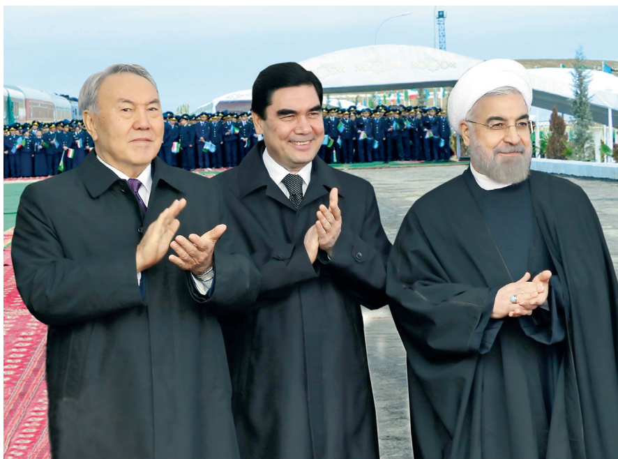
Türkmenistanyň, Gazagystanyň we Eýranyň prezidentleriniň gatnaşmagynda Demirgazyk – Günorta demir ýolunyň işe girizilmegi

Demir ýollar. Demir ýollara ýurduň gan damarlary diýilmegi ýöne ýere däldir. Çünki olar sebitleri hojalyk-ykdysady taýdan birleşdirýär, jebisleşdirýär. Şol sebäpli ýurt garaşsyzlygynyň ilkinji aýynda özbaşdak Türkmen demir ýoly döredildi we täze demir ýollary gurmagyň tehniki-ykdysady esaslandyrmalaryny taýýarlamaklyga girişildi. Eýýäm 1991-nji ýylyň aýagynda Tejen – Sarahs – Maşat (Eýran) demir ýolunyň gurluşygy başlandy. Ýoluň 132 km-ni Türk-