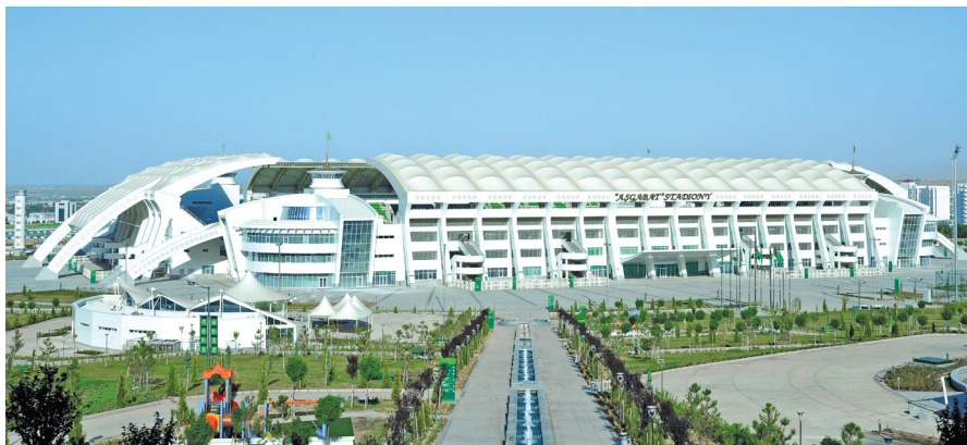
«Aşgabat» köpugurly stadiony

ýüz müňlerçe ýaşlar gatnaşdylar. Mysal üçin, Aşgabadyň köpugurly stadionynda onuň jemleýji çäresinde sportuň woleýbol, basketbol, futbol, tennis, ýeňil atletika we beýleki görnüşleri boýunça ýaryşlar geçirildi. Ýaryşda ýeňijilere baýraklaryň gowşurylmagy estrada aýdymçylarynyň şowhunly konserti bilen utgaşyp gitdi.