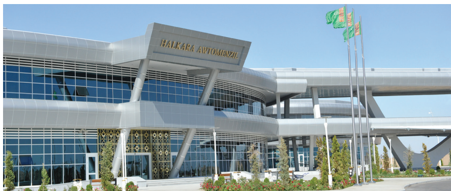
Aşgabat halkara awtoterminaly

2009-njy ýylda awtomobil ýollarynyň çatryklarynda täze desgalar – estakada köprüleri gurlup başlandy. Sankt-Peterburg şäheriniň «Возрождение» önümçilik birleşigi tarapyndan Aşgabatda we Awazada estakada köprüleriniň birnäçesi guruldy. Estakada köprüleri ýollary ýokary galdyryp, pes-