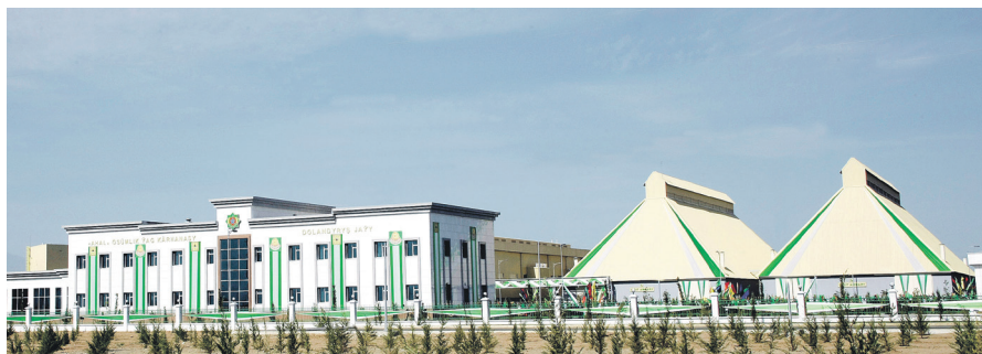
Ruhabat etrabyndaky «Ahal» ýag zawody

Azyk senagaty. Ýeňil senagat ýaly, azyk senagaty hem sarp ediş bazaryna hyzmat edýär. Onda ýag çykarýan, çörek-makaron, süýji-köke, et-süýt öndürýän we käbir beýleki pudaklar ösdürilýär. Olar önki döwürde senagat pudaklary hökmünde emele gelenem bolsalar, tehnologiýa taýdan gowşakdy. Öndürilýän önümleriň hili pesdi. Ilata