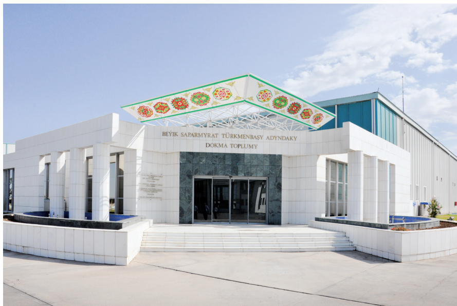
Türkmenbaşy dokma toplumy

Ýeňil senagat. Bu pudakda, esasan, halkyň sarp edýän önümleri öndürilýär. Ýeňil senagatda dokma, tikiñçilik, ýüpek, gön-ayakgap pudaklary we başga-da käbir pudaklar ösdürilýär. Dokma pudagyny ösdürmeklige has uly ähmiýet berilýär. Garaşsyzlyk ýyllarynda şu pudaga 1,6 mlrd amerikan dollary möçberinde serişde goýuldy. Daşary ýurt kompaniýalarynyň gatnaşmagynda Aşgabatda «Türkmenbaşy dokma toplumy», Ruhabat etrabynda jins, dokma toplumlary, Serdar şäherinde, Gökdepede we Baýramalyda dokma toplumlary gurlup, ulanylmaga berildi. Täze tehnologiýalar bilen üpjün edilen toplumlaryň hersinde 4-5, hatda 6 fabrik bolup, olarda önümçilik gutarnykly häsiýete eýedir. Başgaça aýdylanda, toplumlara