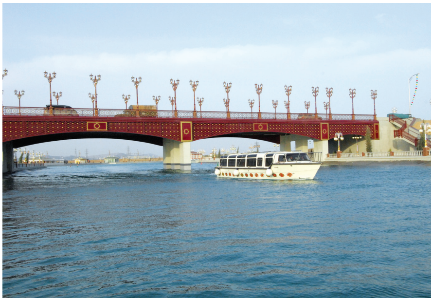
Awaza derýasynyň köprüsi

Häzirki wagtda «Türkmenhowaýollary» döwlet milli gul- lugynyň uçarlary, ýurduň içindäki ugurlar bilen bir hatarda, dünýäniň onlarça şäherlerine, şol sanda Abu-Dabi, Amritsar, Almaty, Bangkok, Birmingem, Deli, Dubaý, London, Moskwa, Milan, Minsk, Pekin, Pariž, Stambul, Sankt-Peterburg, Frankfurt we beýlekilere yzygiderli gatnaýarlar. 2030-njy ýyla çenli «Boing» uçarlarynyň sanyny 43-e ýetirmek we dünýäniň ýene-de ençeme şäherlerine howa ýollaryny açmak bellenilýär.