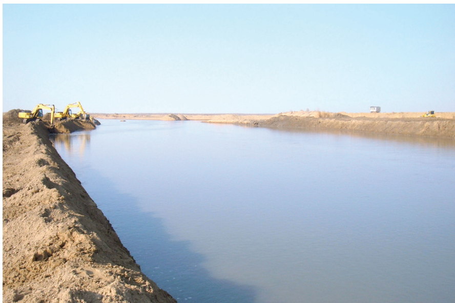
«Altyn asyr» Türkmen köli

Ekerançylyk. Bu pudagy ösdürmek suw, tehnika, dökünler bilen üpjünçilige baglydyr. Suw hojalyk gurluşygy giň