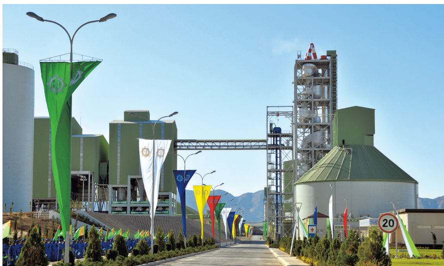
Balkan welaýatynyň sement zawody

Türkmenistanyň gündogarynda gazylyp alynýan magdanlaryň deňi-taýy bolmadyk ojagy Magdanly (ozalky Gowurdak) – Köýtendag sebitidir. Bu ýerde gips bilen anhidridiň, daş hem kaliý duzларыnyň, kükürt bilen selestiniň ägirt uly gorlary bar. Geologiýa gözlegleriniň netijesinde reňkli metallurgiýany ös-