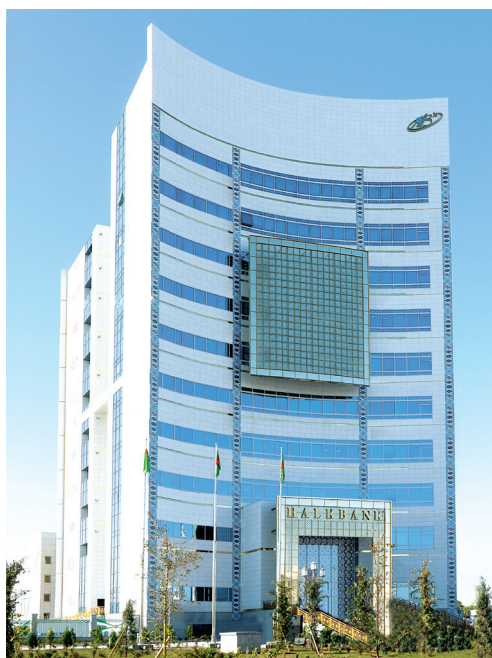
«Halkbank» döwlet täjirçilik banky

Türkmenistanda iki derejeli bank ulgamy kemala geldi we hereket edýär. Onda Merkezi banka aýratyn orun degişlidir. Nagt pullary çykarmak we olary dolanyşykdan aýyrmak hukugy diňe şu banka berildi. Merkezi bank, esasan, dört ugur boýunça: ýurduň pul birliginiň durnuklylygyny üpjün etmek; bahalaryň derejesiniň üýtgeşsizligini gazanmak; bank ulga-