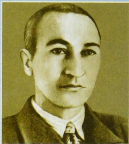
Ata Gowşudow (1903-1953)

Görnükli türkmen kyssaçysy Türkmenistanyň halk ýazyjysy Ata Gowşudow 1903-nji ýylda Ahal welaýatynyň Büzmeýin obasynda (häzirki Abadan şäheri) dogulýar. Ol ilki oba mekdebinde okaýar. Soňra düýpli bilim almak üçin Aşgabatdaky mugallymçylyk mekdebinde we Moskwada okuwyny dowam etdirýär. Moskwadan gelensoň, Aşgabatda dürli wezipelerde işleýär. Ýazyjy 1929-njy ýylda ilkinji "Ganly jeňnel" pyesasyny ýazýar.