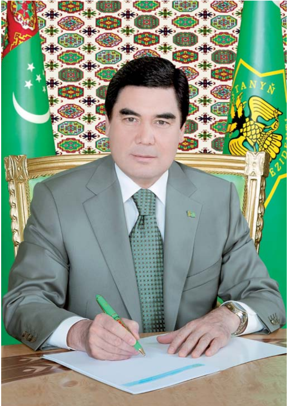
TÜRKMENISTANYŇ PREZIDENTI GURBANGULY BERDIMUHAMEDOW