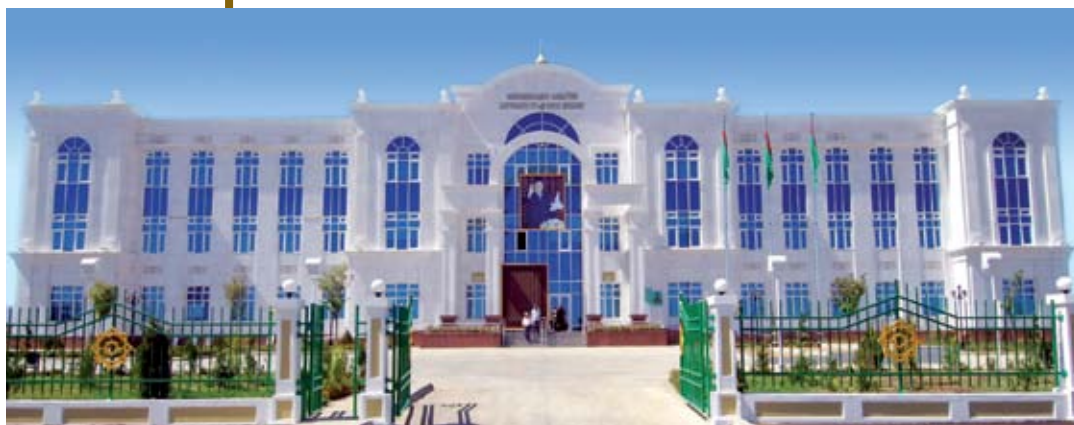
Gökdepe etrabynyň Yzgant obasyndaky Berdimuhamet Annaýew adyndaky 27-nji orta mekdep.